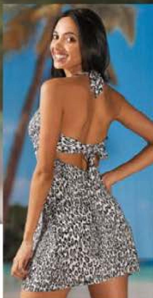
PRENDISOLE LEOPARD LINEASPRINT

Collezione Lady, 95% poliestere, 5% elastan 197