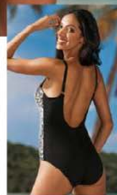
COSTUME INTERO LEOPARD LINEASPRINT

coppe imbottite con ferretto, spalline regolabili in nero tinta unita: un classico con carattere