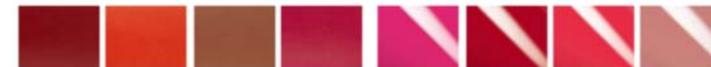
red supreme coral fever marvellous mocha ravishing rose pink obsession red is red keep it bright dreamworld