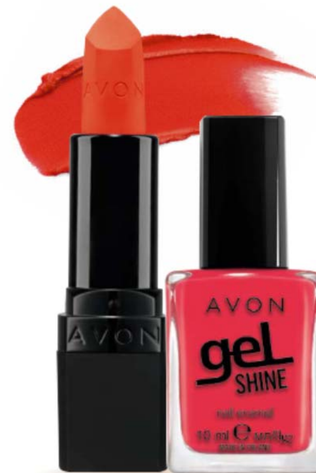
ROSSETTO ULTRA MATTE 3,6 g