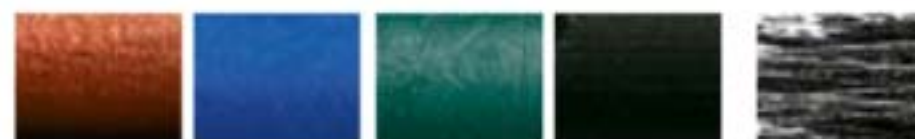
bronze azure blue emerald blackest black blackest black