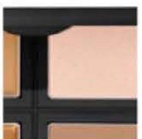
glow and sculpt

Contouring: prova il nuovo trend e definisci i tuoi lineamenti come una vera make-up artist!