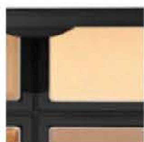
gleam and shape